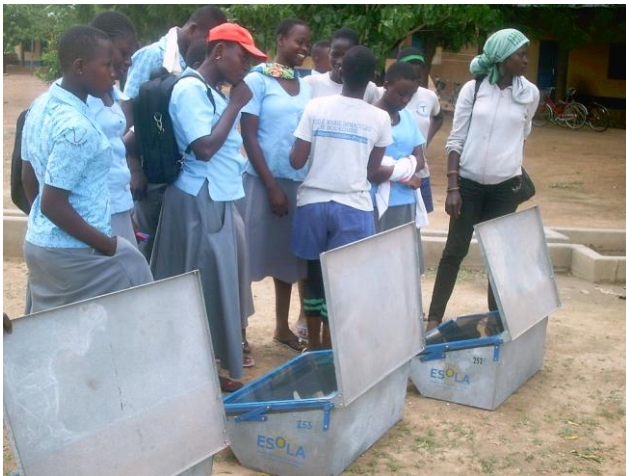
Eén van de instructielessen voor leerlingen