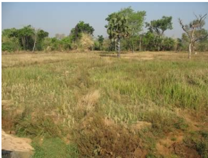
Een van de geïrrigeerde (rijst)velden