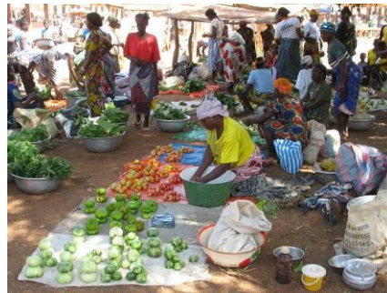
Na de rijst wordt groente geteeld en verkocht