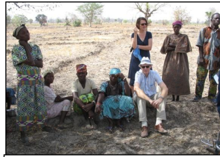
Discussie met een boerengroep

activiteit wordt na 2 jaar opgezet voor de meest