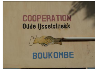
De samenwerking verbeeld in de gemeente Boukombé

Het eerste programma start in 2003 en betreft het stimuleren van economische activiteiten in Boukombé. De titel is "Duurzaam zonder grenzen". Een economisch steunfonds wordt opgericht voor kleine ondernemers om vernieuwende activiteiten te ondernemen en hun business kwaliteiten te verbeteren.