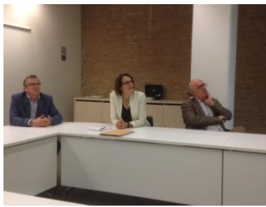
Afsluitende bijeenkomst bij VNG-I in Den Haag, eind januari 2017