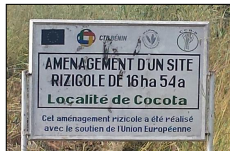
Een irrigatieveld dat begeleid wordt door de dienst van Toucountouna

groepen niet in staat reparaties uit te voeren. De in dit programma opgezette 'cellules' werden hiervoor verantwoordelijk. Via training, uitwisseling en coaching door de Nederlandse en een Beninese expert, werd inhoud gegeven aan deze verantwoordelijkheid. Daarmee werden in de loop van het project al flinke successen geboekt. Zoals het afdwingen van de herbouwing door de donor van een verkeerd aangelegd irrigatieschema.