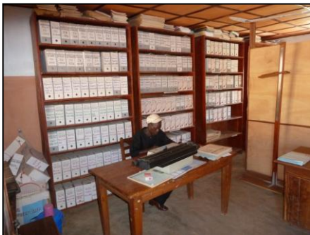
Het herstelde papieren archief van de burgerlijke stand, 2010

In 2006 start het tweede samenwerkingsprogramma onder de naam Logo-Zuid. Dit programma ondersteunt de lokale gemeente om haar eigen belastingheffing te verbeteren. Kernactiviteiten vormen dan de verbetering en digitalisering van de burgerlijke stand in de gemeente Boukombé, de communicatie met de bevolking en de verbetering van twee lokale belastingssystemen. Met een verlenging loopt dit project tot eind 2010.