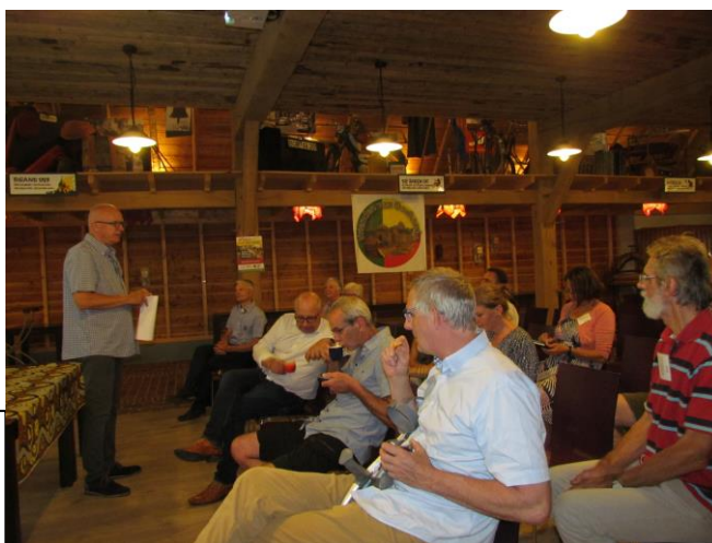
De klimaatavond tijdens de Afrikaweek Oude IJsselstreek