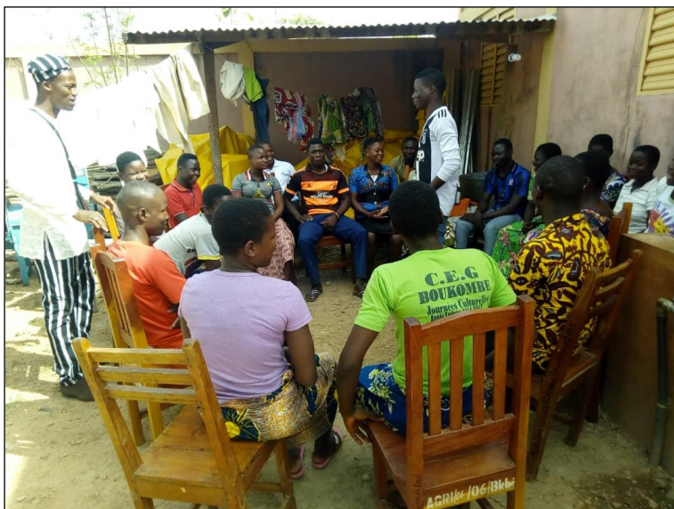
Spelleiderstraining in Boukombé

Eind 2019 is het eindrapport beschikbaar gekomen en zijn de donororganisaties geïnformeerd.