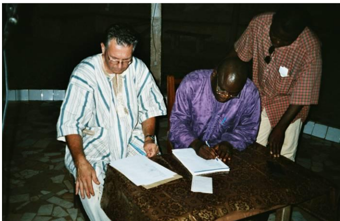
Ondertekening van de stedenbandovereenkomst in Boukombé door de toenmalige prefect in 2002

De Stichting Vrienden van Boukombé (VvB) is opgericht met als doel: het ondersteunen van lokale initiatieven in de gemeente Boukombé in Benin, West-Afrika. Vanuit de betrokkenheid van een aantal mensen bij de stedenband gemeente Wisch en de